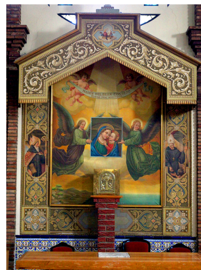
Retablo Capilla Rotonda

El buen consejo de María lo encontramos en el Evangelio, en las bodas de Caná (Jn 2, 5): "Haced lo que Él os diga".