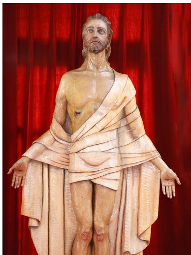
Cristo Resucitado. Capilla Redonda