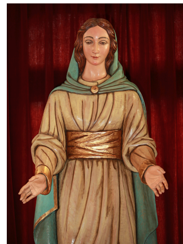
Virgen de la Esperanza. Capilla Redonda

Su primera salida procesional fue en la madrugada del Viernes Santo de 1981.