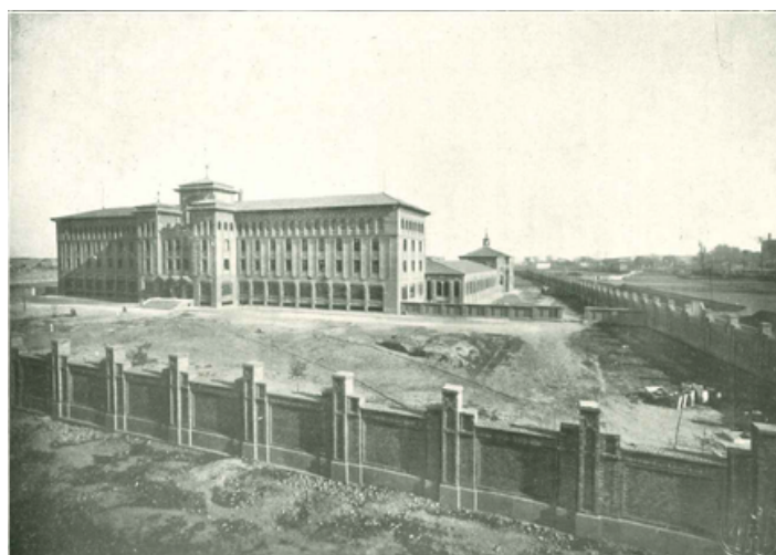
Fachadas norte y poniente del colegio